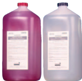
Set químico revelador + fijador