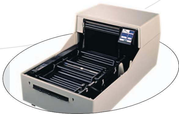
Dos bloques de rodillos de fácil extracción para su limpieza