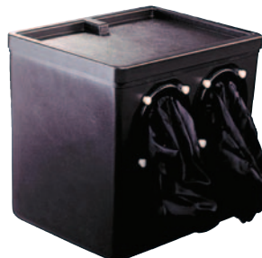
Cámara oscura opcional