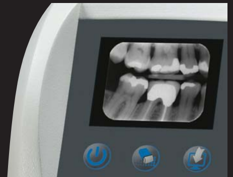
Obtención de la radiografía