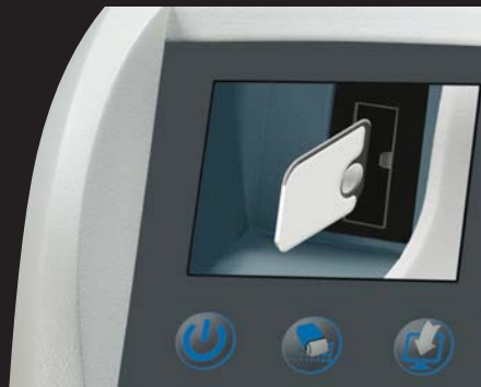
Arranque del escáner