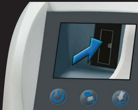
En espera de la PRLM*